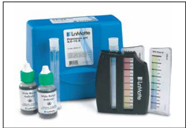
Water Testing Kitbox