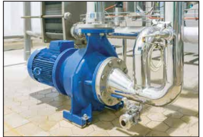
পানির পাম্প স্থাপন