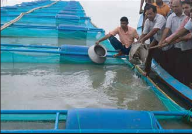
খাঁচায় মাছ চাষ