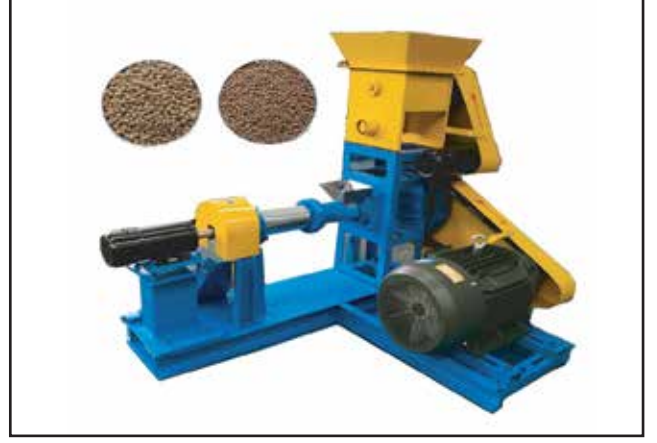
পিলেট খাদ্য তৈরীর মেশিন ক্রয়