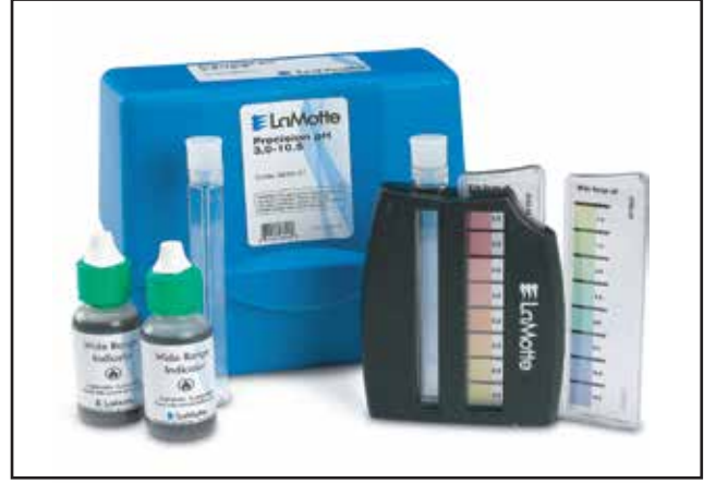
পানির গুনাগুন পরিষ্কার কিটবক্স ক্রয়