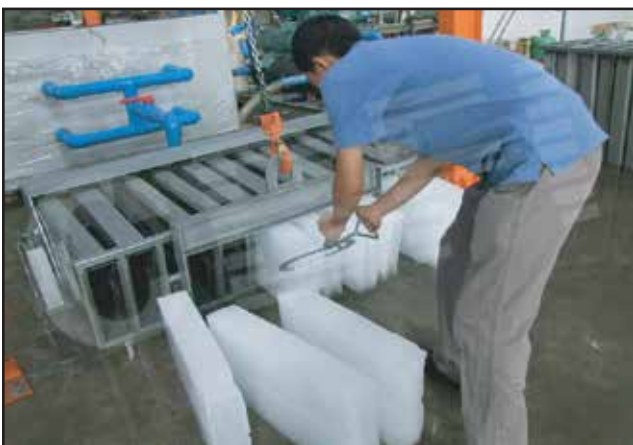
Small Ice Plant