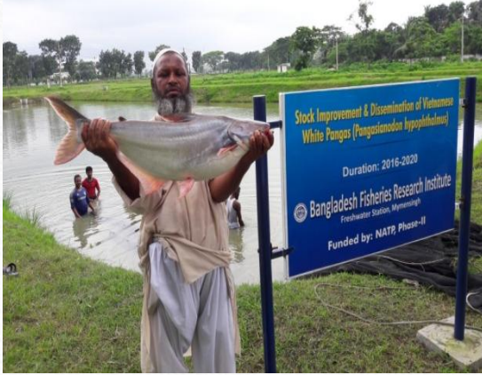
ভিয়েতনামিজ হোয়াইট পাঙ্গাস