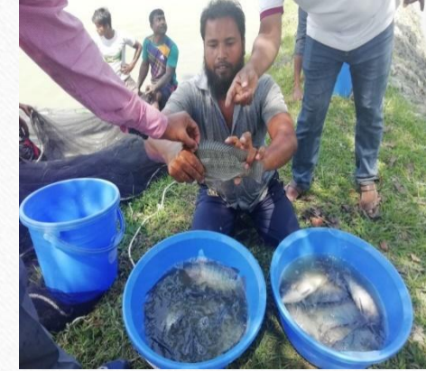
GIFT (genetically improved farmed tilapia)